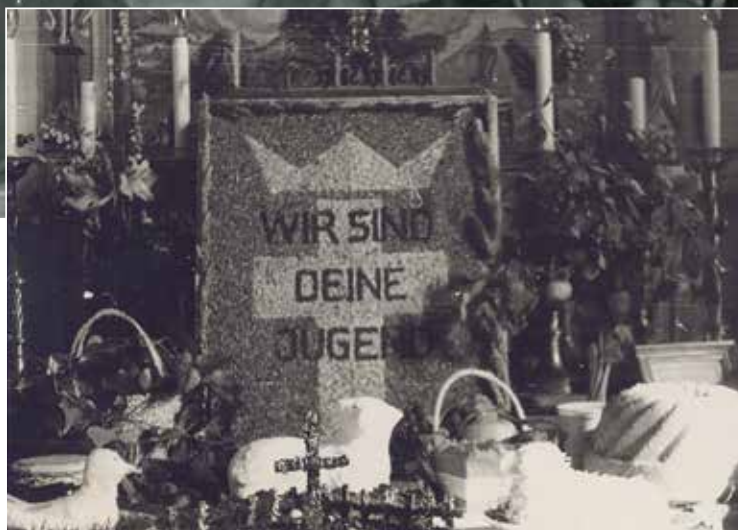
Die geschmückte Kirche in St. Radegund, Erntedank 1951