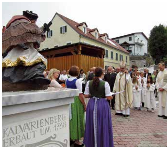
St. Radegunder Dreigesang

Hinweis: Im Sonntagsblatt Nr. 32 vom 11. August war ein ausführlicher Bericht.