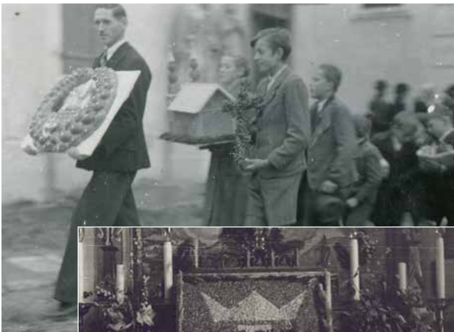
Einzug mit den Erntegaben um 1936 in Kumberg