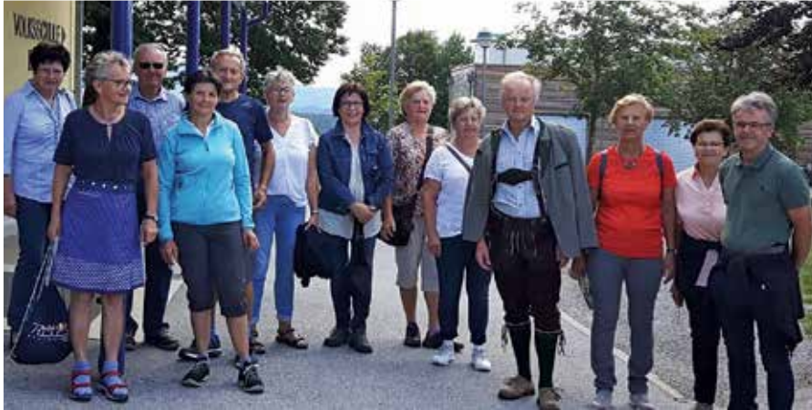
Die diesjährigen Kumberger TeilnehmerInnen an der Loretowallfahrt

von Gutenberg, Hr. Albrecher begrüßt. Wir ziehen zur Kapelle hinauf, wo die Feier, begleitet von der Musikkapelle mit den Initien um die Kapelle beginnt. Danach feiern wir gemeinsam mit allen Gutenbergern die Hl. Messe, die vom Chor musikalisch mitgestaltet wird. Nach der Hl. Messe haben wir Gelegenheit, uns beim Loretowirt im Freien hinzusetzen und das erste erfrischende Getränk zu genießen und uns mit einem guten Essen zu stärken. Für unsere kleinen Wallfahrer gibt es eine gut besuchte Hüpfburg zum Austoben und bei den traditionellen Standln begehrte Spielzeuge. Es ist ein großes Treffen von vielen Familien, die hier gerne zusammenkommen und es hat damit eine ganz eigene Atmosphäre, dieses Loretofest, von dem wir, wie alle Jahre, gestärkt an Körper und Geist wieder nach Hause zurückkehren.