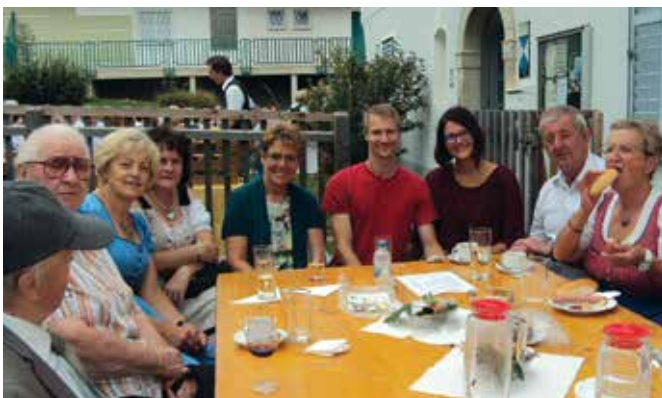
Kirchenchormitglieder mit Organistin und Trompeter