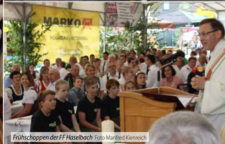
Frühschoppen der FF Haselbach