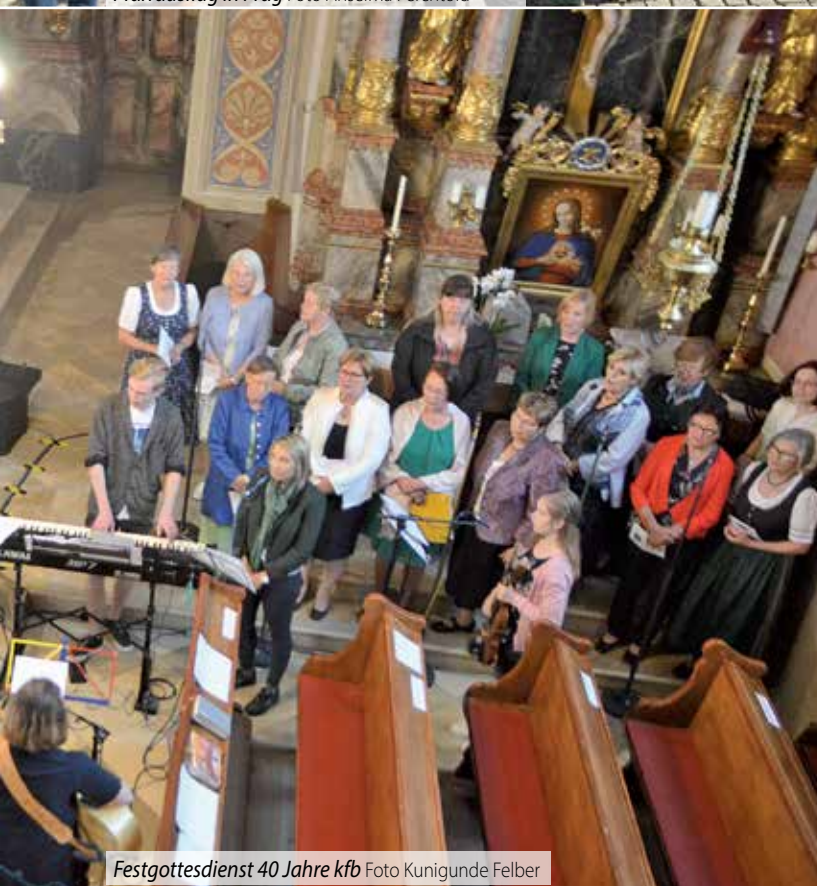
Festgottesdienst 40 Jahre kfb