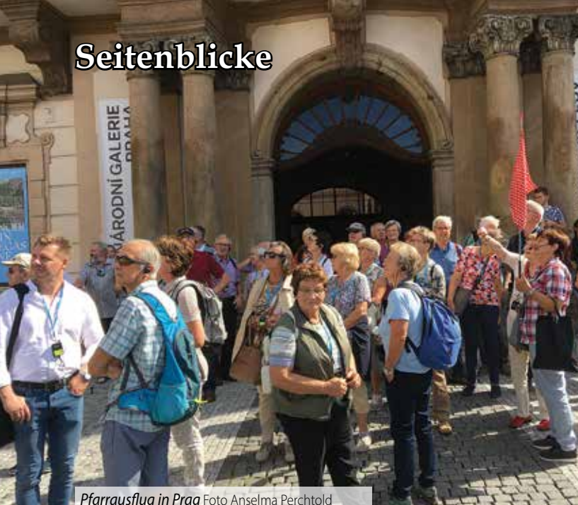
Pfarrausflug in Prag