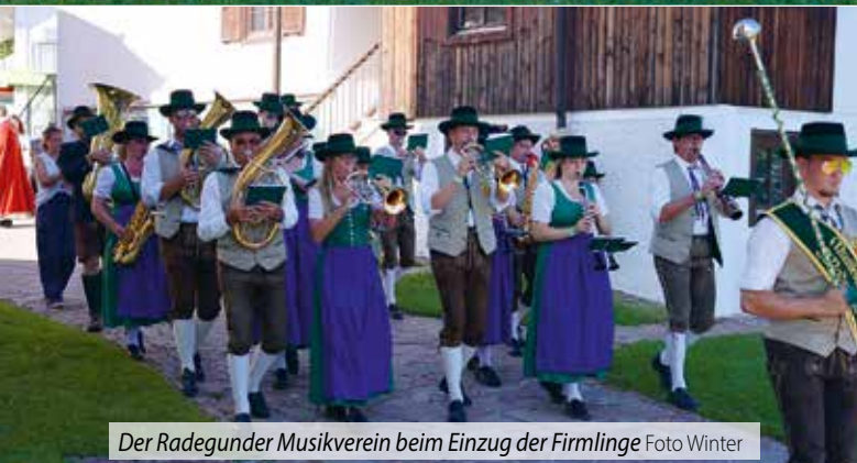
Der Radegunder Musikverein beim Einzug der Firmlinge