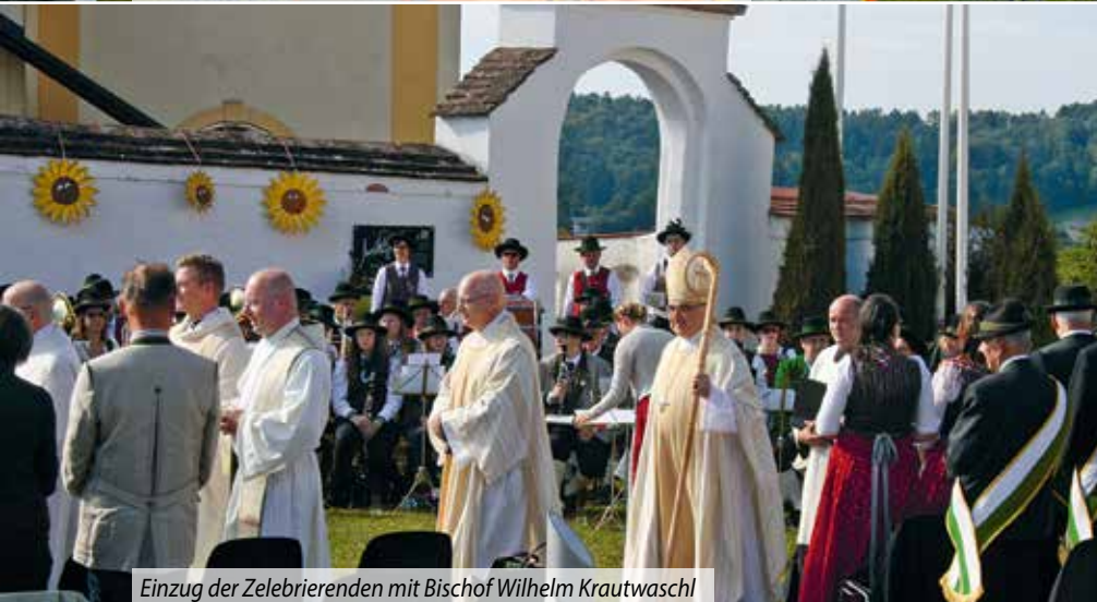
Einzug der Zelebrierenden mit Bischof Wilhelm Krautwaschl