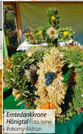
Erntedankkronne Hönigthal