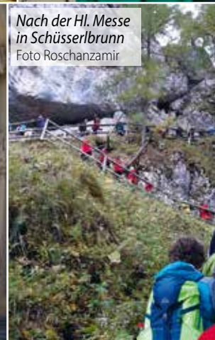
Nach der Hl. Messe in Schüsslerbrunn