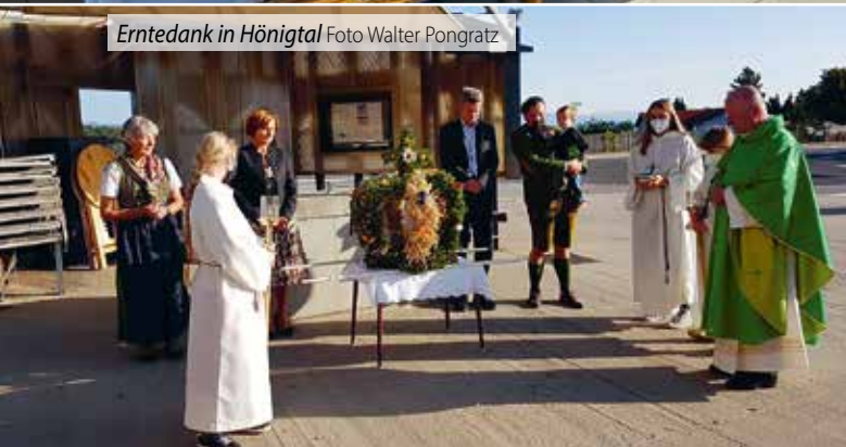
Erntedank in Hönigthal