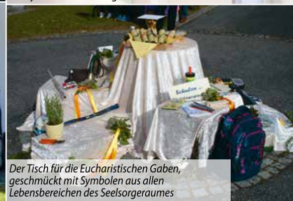
Der Tisch für die Eucharistischen Gaben, geschmückt mit Symbolen aus allen Lebensbereichen des Seelsorgeraumes

der Engeldarstellungen in allen Kirchen des Seelsorgeraumes - ein Kinderprogramm mit Hüpfkirche und Kinderschminken, sowie um 13 Uhr und um 15 Uhr Kirchenführungen. Der Kumberger Historiker Bernhard Reismann brachte dabei mehr als 50 Interessierten in kurzen Zügen die Pfarrgeschichte von St. Marein und die Besonderheiten der Pfarrkirche näher - und deren gibt es einige. Einen stimmungs- und qualitätsvollen Abschluss fanden diese Führungen jeweils durch ein kleines