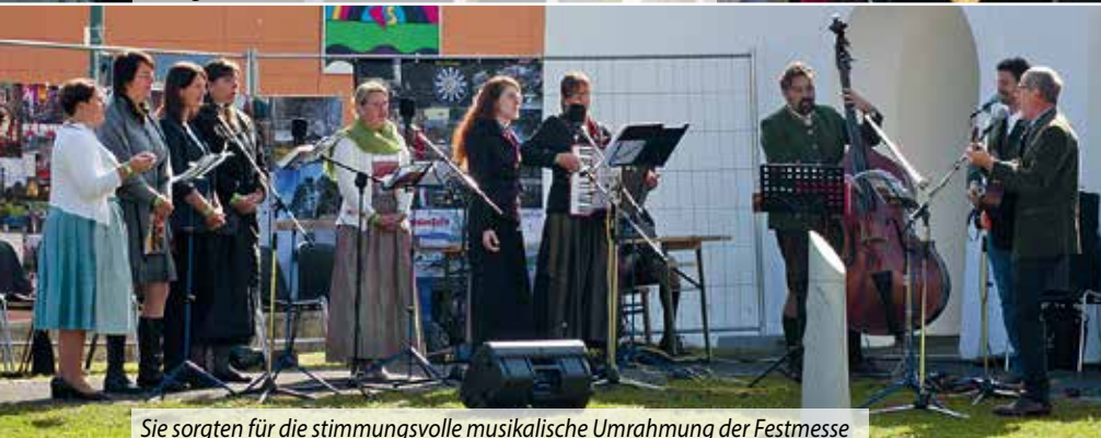
Sie sorgten für die stimmungsvolle musikalische Umrahmung der Festmesse