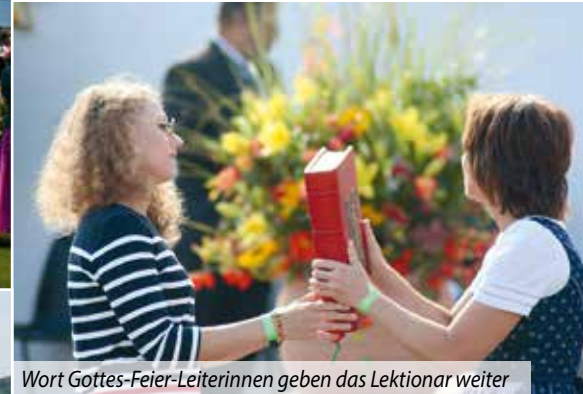
Wort Gottes-Feier-Leiterinnen geben das Lektionar weiter