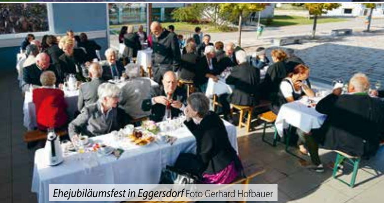
Ehejubiläumsfest in Eggersdorf