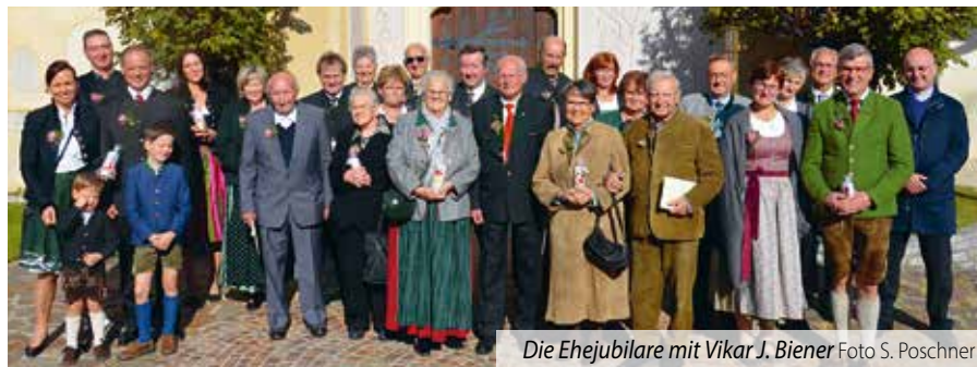
Die Ehejubilare mit Vikar J. Biener