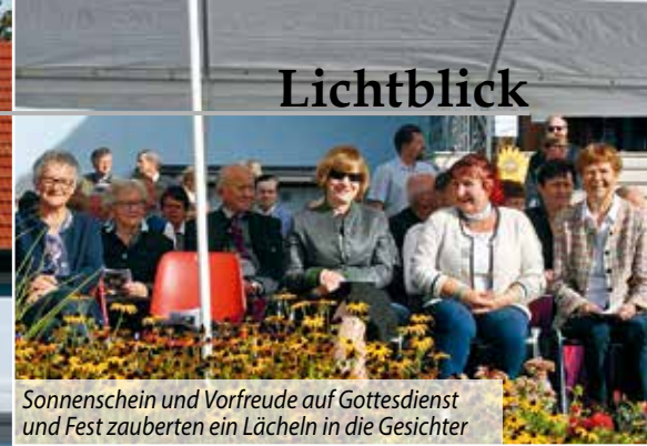
Sonnenschein und Vorfreude auf Gottesdienst und Fest zauberten ein Lächeln in die Gesichter