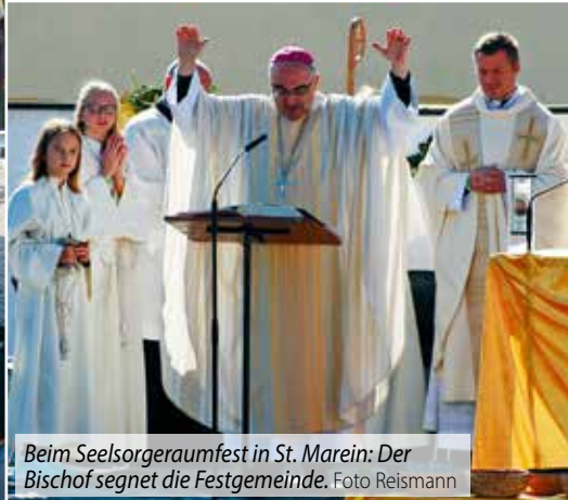
Beim Seelsorgeraumfest in St. Marein: Der Bischof segnet die Festgemeinde.