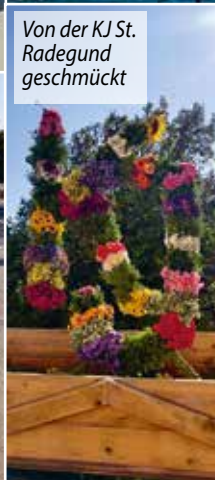
Von der KJ St. Radegund geschmückt