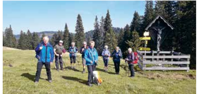
oben: Die Kumberger Wallfahrerguppe vor der Leopold Wittmaier-Hütte unten: Rast beim Herrenbodenkreuz am 8. September, wenige Stunden vor der Ankunft im Mariazell