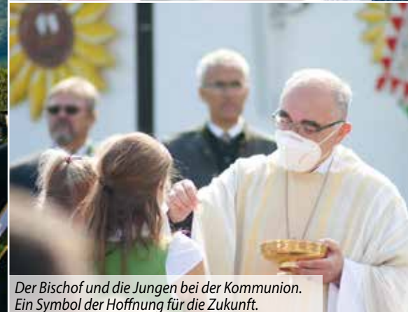
Der Bischof und die Jungen bei der Kommunion. Ein Symbol der Hoffnung für die Zukunft.