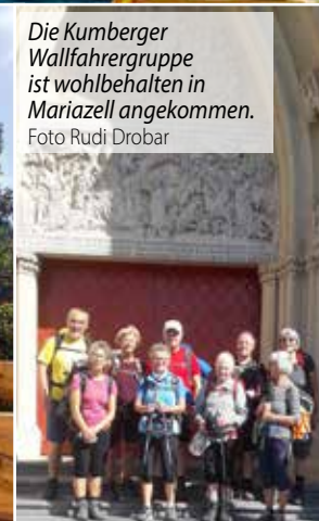
Die Kumberger Wallfahrergruppe ist wohlbehalten in Mariazell angekommen.