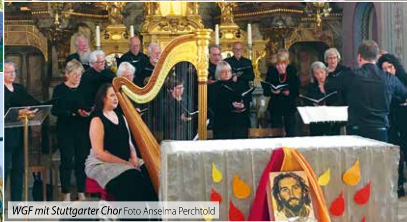
WGF mit Stuttgarter Chor