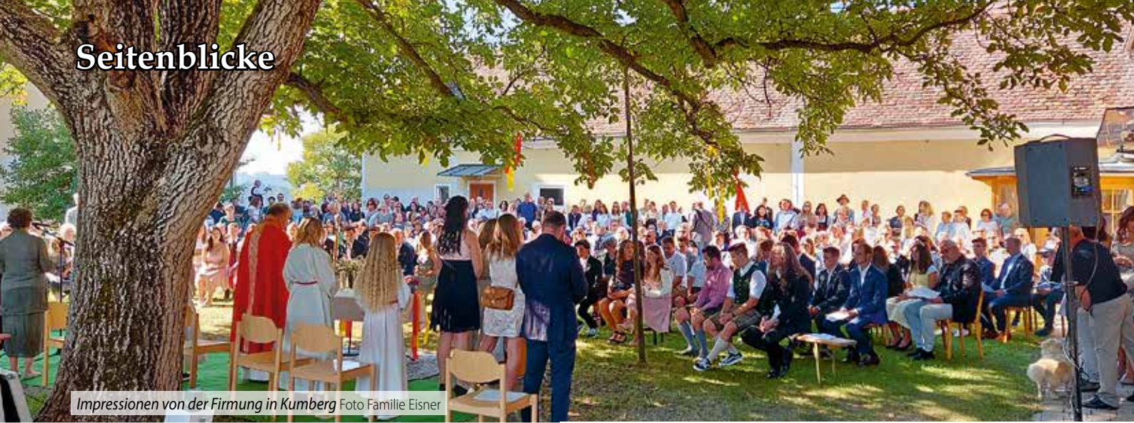
Impressionen von der Firmung in Kumberg