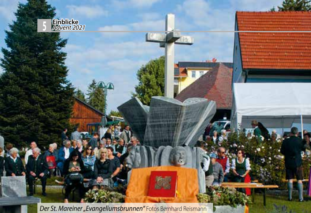
Der St. Mareiner „Evangeliumsbrunnen“