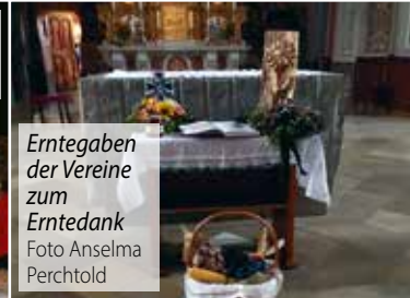
Erntegaben der Vereine zum Erntedank